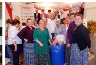
Kolejna edycja Dnia Gaździny