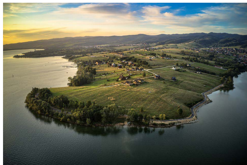
Ścieżka rowerowa z lotu ptaka

Prace przy budowie przeszło 30 km pętli dobiegły końca. Podbudowy, gotowe mosty, zbudowane tzw. Miejsca Obsługi Rowerzystów, gdzie użytkownicy ścieżki mogą odpocząć oraz wyasfaltowane pętle trasy z panoramą na Jezioro Czorsztyńskie to prawdziwa gratka dla wszystkich, którzy lubią aktywny wypoczynek.