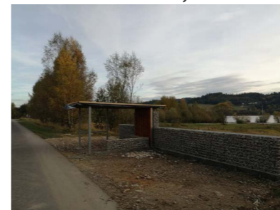
Jedna z zatok przystankowych na trasie