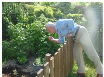
Corocznie w Gminie Czorsztyn odbywa się konkurs pn Mój Ogród Kwiatowy. Na zdj Przewodniczący Konkursu podczas pracy