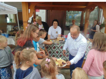
Festyn - Lato w Hubie