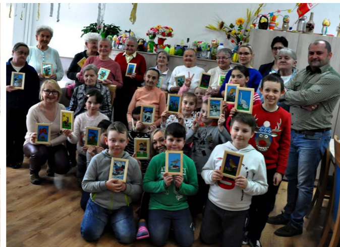
Seniorzy i Juniorzy podczas zajęć manualnych