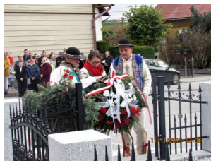
Jak co roku 11 listopada pamiętano o poległych w walce o wolną Polskę

Jednak zabawa to tylko część działalności prowadzonej przez tutejsze Gminne Centrum Kultury Czorsztyn. W ciągu roku do mieszkańców kierowano bogaty wachlarz zajęć o charakterze edukacyjnym oraz konkursów tematycznych. Nie zabrakło zajęć z zakresu dziedzictwa kulturowego, warsztatów manualnych czy muzycznych. Poniżej wspominamy kilka z nich: