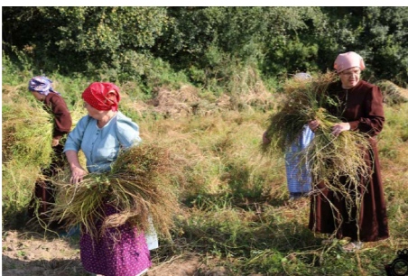
Zdjęcia z ujęć do filmu Jak to z Lnem bywało