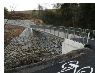
Na pętli rowerowej powstało kilka mostów

rozpoczyna się od Huby i prowadzi do Mizernej. Warto w tym miejscu dodać, że trasa rowerowa wokół Jeziora Czorsztyńskiego przeplata się i uzupełnia nawzajem z tą przygotowywaną przez Zarząd Dróg Wojewódzkich w ramach VeloDunajec. Długość planowanej trasy wokół zbiornika wynosi 23 km, a wraz z fragmentami VeloDunajec, które ją przeplatają – ponad 35 km. Na trasie powstałej w naszej Gminie powstało aż osiem mostów oraz wiele przejść brodowych, w tym przejście o charakterze obszaru chronionego z żeremiami bobrowymi. Połączenie pomiędzy dwoma końcami ścieżek zapewnia prom. Inne rozwiązanie, ze względu na Pieśniński Park Narodowy nie było możliwe.