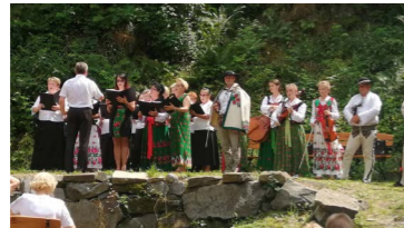
Dni Kluszkowiec jak zawsze rozpoczęły się Mszą św. celebrowaną w Wąwozie Papieskim