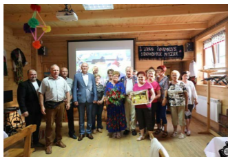
Projekcja filmu Jak to z Lnem bywało