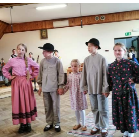
Zespół Mali Maniowianie podczas festynu w Maniowach

Jednak zabawa to tylko część działalności prowadzonej przez tutejsze Gminne Centrum Kultury Czorsztyn. W ciągu roku do mieszkańców kierowano bogaty wachlarz zajęć o charakterze edukacyjnym oraz konkursów tematycznych. Nie zabrakło zajęć z zakresu dziedzictwa kulturowego, warsztatów manualnych czy muzycznych. Poniżej wspominamy kilka z nich: