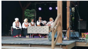
Koło Gospoń Wiejskich z występem podczas festynu Pod Trzema Koronami