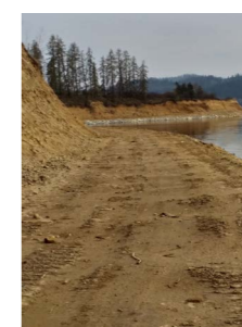
Prace budowlane rok 2018