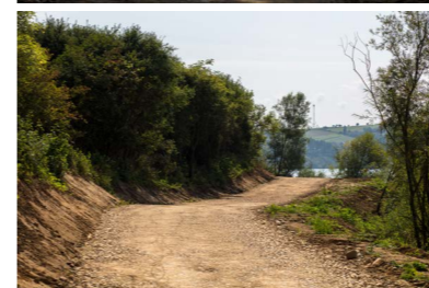
Prace budowlane na etapie utwardzania trasy