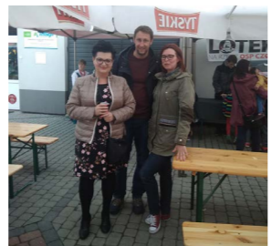
Rozpoczęcie sezonu turystycznego w Czorsztynie