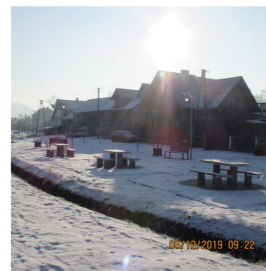
Zamontowano ławostoly oraz stoly do tenisa stołowego