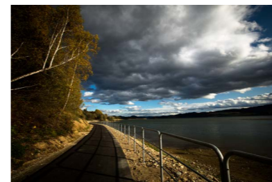
Prace nad ścieżką rowerową dobiegły końca