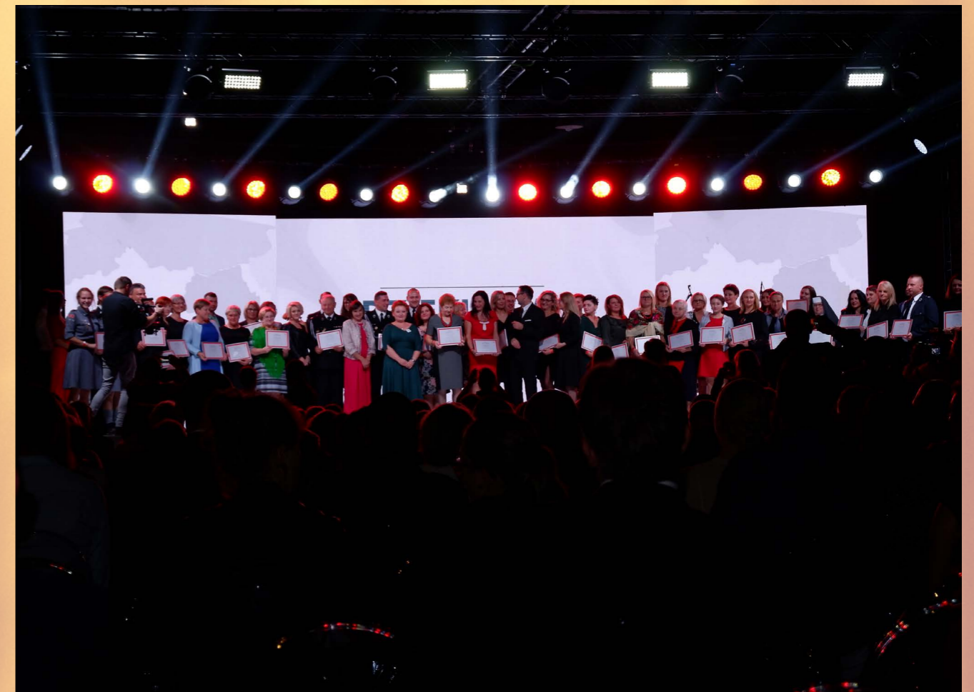
Uroczysta gala z okazji otrzymania dofinansowania miała miejsce w Katowicach

Kwota pozyskanego dofinansowania to 10 000 zł.