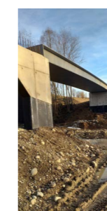
Prace budowlane - wiosna 2019

Dzięki uzyskanemu dofinansowaniu Gmina miała możliwość realizacji dwóch projektów w ramach Regionalnego Programu Operacyjnego dla Województwa Małopolskiego na lata 2014-2020, w ramach 6 Osi Priorytetowej Dziedzictwo regionalne, działanie 6.3 Rozwój wewnętrznych potencjałów regionu, poddziałanie 6.3.3 Zagospodarowanie rekreacyjne i turystyczne otoczenia zbiorników wodnych pn.: „Budowa ścieżki rowerowej dookoła Jeziora Czorsztyńskiego – odcinek I: Czarna Dama – trasa rowerowa w Czorsztynie (od miejscowości Mizerna do miejscowości Czorsztyn Nadzamcze)”, „Budowa ścieżki rowerowej dookoła Jeziora Czorsztyńskiego – odcinek II: Zatopiona Osada – trasa rowerowa w Czorsztynie (od miejscowości Huba do miejscowości Mizerna)”.