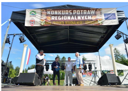
Konkurs Potraw Regionalnych oraz Pierwsza Edycja Targów Produktu Regionalnego i Górskiego

Rok 2019 to czas, w którym świętowaliśmy również kilka pięknych Jubileuszy...działalności twórczej, społecznej czy pożycia małżeńskiego.