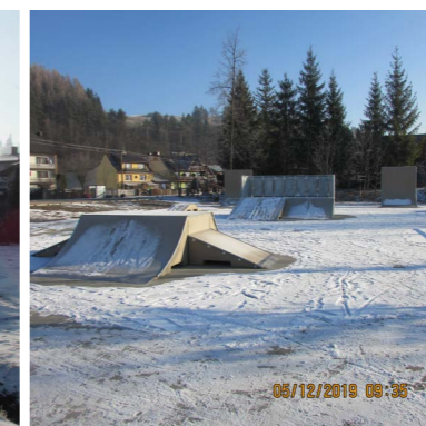
Plac rekreacyjny powstały w ramach projektu

Odebrano i oddano do użytku komfortowe i bezpieczne miejsce do zabawy, jakim jest plac zabaw w miejscowości Huba. Tuż obok niego powstała siłownia plenerowa, gdzie rodzice mogą połączyć aktywny wypoczynek z doglądaniem swoich pociech.