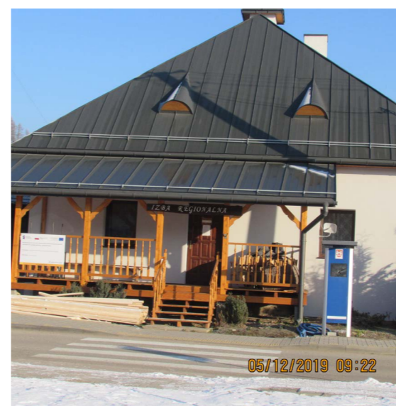
Izba Regionalna w Sromowcach Wyżnych

Gmina Czorsztyn zakończyła realizację inwestycji pn. „Rewitalizacja wsi Sromowce Wyżne celem stworzenia przestrzennych warunków do rozwoju społeczno – gospodarczego”. Wartość projektu zgodnie z wnioskiem wyniosła 4 563 757,86 zł z czego wartość dofinansowania to 2 864 798,87 zł