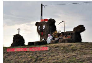
Tegoroczne dożynki odbyły się w sołectwie Mizerna