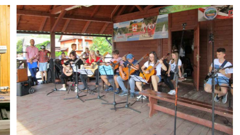
Wieczór z Folklorem w Sromowcach Wyżnych

W Gminie Czorsztyn pod względem kulturalnym w mijającym roku działa się sporo. Działania prowadzone przez Gminne Centrum Kultury Gminy Czorsztyn prowadzone były wielotorowo. W okresie letnim skupiały się na organizacji imprez i festynów Gminnych, wśród których prym, jako największe wiodły: Konkurs Potraw Regionalnych, po raz pierwszy połączony z Targami Produktu Turystycznego oraz Górskiego, Dożynki Gminne oraz festyny odbywające się w każdy letni weekend w sołectwach gminnych. Każdy z nich nieco różny, z innym programem artystycznym...na każdym bogata oferta kulturalna oraz regionalne jedzenie. Wszystkie łączył jeden wspólny mianownik DOBRA ZABAWA!