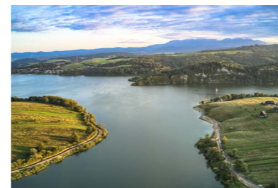
Ścieżka rowerowa z panoramą na Jezioro Czorsztyńskie

Przypomnijmy, że trasa rowerowa, na którą samorząd gminny otrzymał łącznie ponad 10 mln dofinansowania budowana była w dwóch etapach: Pierwszy odcinek o nazwie Czarna Dama obejmuje trasę od Mizernej aż do Czorsztyna, natomiast odcinek drugi o nazwie Zatopiona Osada