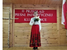
Przeгляд Pieśni Patriotycznej