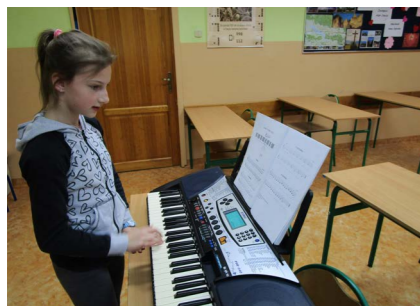
Nauka gry na keyboardzie podczas zajęć muzycznych organizowanych w Sromowcach Niznych