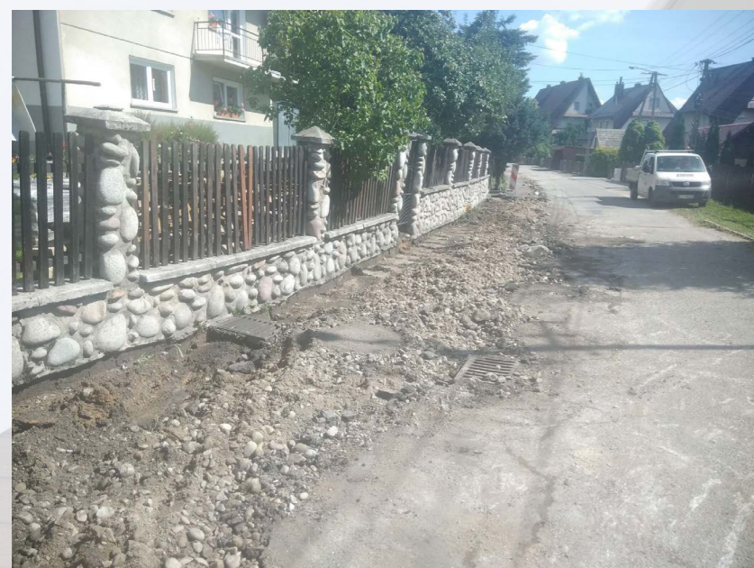
ul. Słoneczna w Kluskowcach