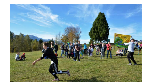
Rodzinny Piknik z Latawcem organizowany co roku wspólnie z Gminą Łapsze Niżne

W Gminie Czorsztyn pod względem kulturalnym w mijającym roku działa się sporo. Działania prowadzone przez Gminne Centrum Kultury Gminy Czorsztyn prowadzone były wielotorowo. W okresie letnim skupiały się na organizacji imprez i festynów Gminnych, wśród których prym, jako największe wiodły: Konkurs Potraw Regionalnych, po raz pierwszy połączony z Targami Produktu Turystycznego oraz Górskiego, Dożynki Gminne oraz festyny odbywające się w każdy letni weekend w sołectwach gminnych. Każdy z nich nieco różny, z innym programem artystycznym...na każdym bogata oferta kulturalna oraz regionalne jedzenie. Wszystkie łączył jeden wspólny mianownik DOBRA ZABAWA!