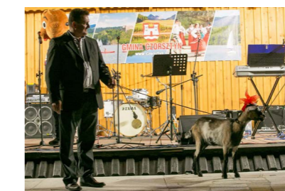
Sołtys wsi podczas festynu w Mizernej

Nastał zimowy czas, dni stały się krótsze i chłodniejsze, jednakże w chwili obecnej postaramy się chociaż na chwilę powrócić do letnich wakacyjnych dni na świetlicach, czy do imprez organizowanych w niedzielne popołudnia, które dostarczały zarówno rozrywki, jak również pozwalały na integrację mieszkańców.