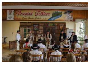
Kolejna edycja konkursu Nuta Dunajca